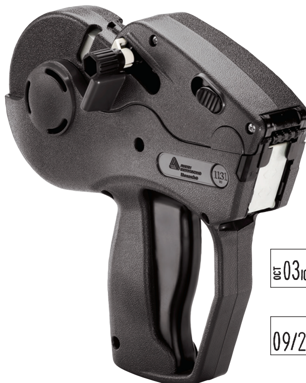
Étiqueteuse à une ligne Monarch® 1131®

Des informations complètes sur la garantie ainsi que d'autres termes et conditions sont disponibles sur demande.