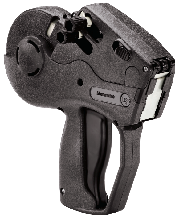
Étiqueteuse à deux lignes Monarch® 1136®

Des informations complètes sur la garantie ainsi que d'autres termes et conditions sont disponibles sur demande.